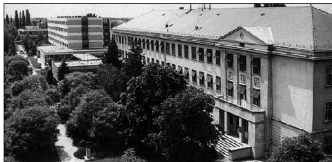
Petőfi tér 1.