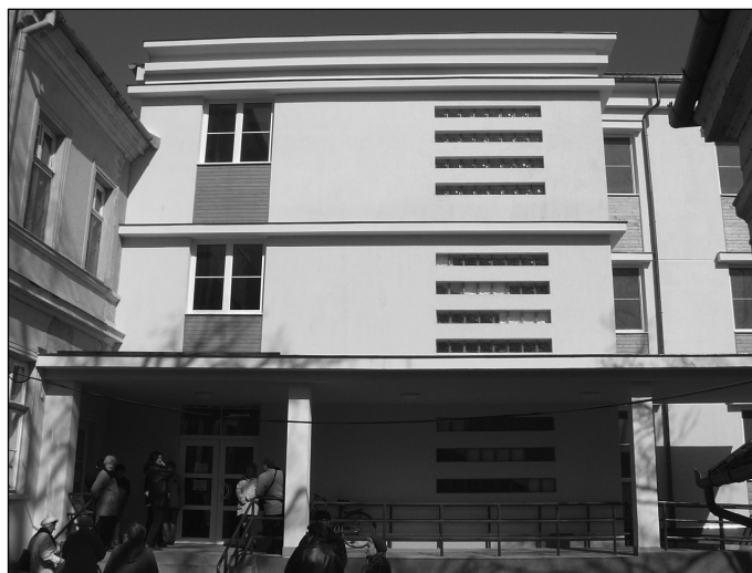
A szép, új épületszárny.

titkár úr részére, valamint ezen írás alapján az országgyűlési képviselőnk írt még egy levelet a miniszterelnök úrnak és megkérte arra, hogy segítsen ebben az ügyben a városnak. Nagyon bízom abban, hogy a szakmai szempontokat átgondolva, és nem egy általános sablon alapján fogják a kórházunkat megváltoztatni, hanem figyelembe veszik a térség helyi sajátosságait. Hiszen nem lehet egy lapon kezelni például a Dunántúlt és a Tiszántúlt. Teljesen más a település szerkezet, más a lakosság szociális helyzete és anyagi terhelhetősége.