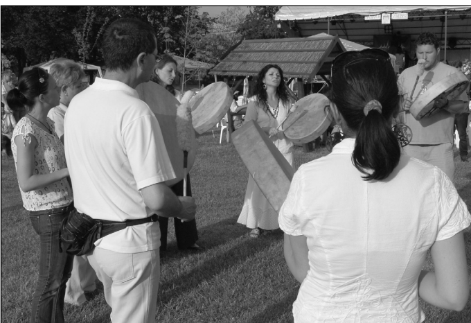
A sámán dobolás és a közös éneklés...