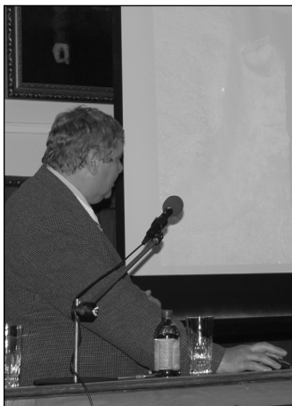
A tudományos konferencián Mezőtúr régészeti emlékeinek témakörében hallgathattak előadásokat az érdeklődők