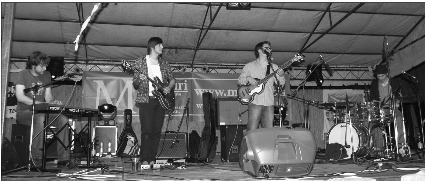
A Qualitons koncertjével zárult a három nap programja.