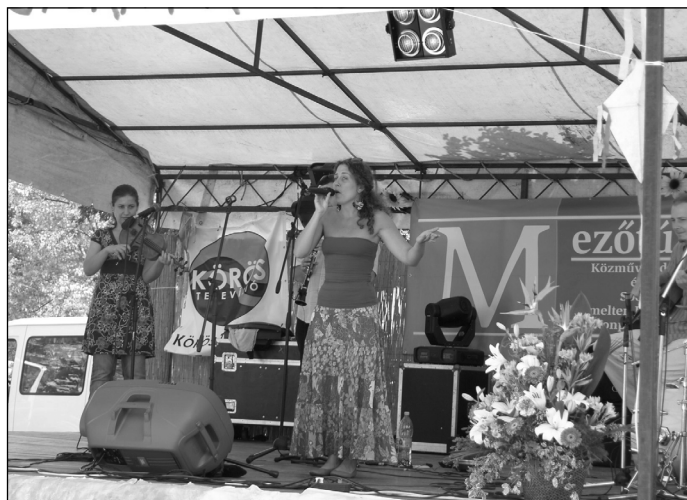
A Makám együttes koncertje a kicsiknek és a nagyoknak is kellemes élményt nyújtott