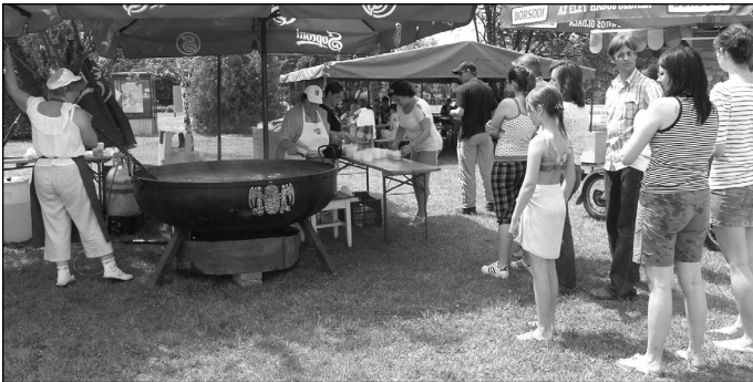
Hatalmas üstben főtt a babgulyás mindenki örömére.

Immár második alkalommal ünnepelhetjük együtt Mezőtúr város napját, május 20-22-én, több helyszínen. A színes programok között mindenki megtalálhatta a kedvére való programot, hiszen az első nap tudományos előadásai, a második nap főzőversenye, városkapitány választása, sport versenyei, és színes színpadi produkciói, valamint a harmadik nap gyermeknap programjai, valóban minden generáció igényeit kielégítették.