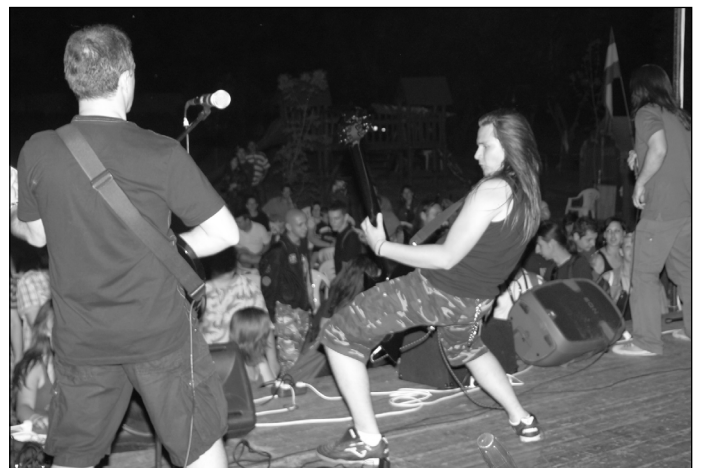
A mezőtúri Magma zenekar tíz éves lett, amelyet a városnapon fergeteges jubileumi koncerttel ünnepelt.