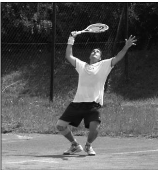
A sportversenyek nagy sikerrel zajlottak a Sportcentrumban. (Eredmények a 11. oldalon)