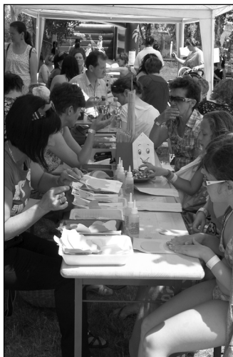
Kézműves foglalkozás, arc- és pólófestés a hűvösben