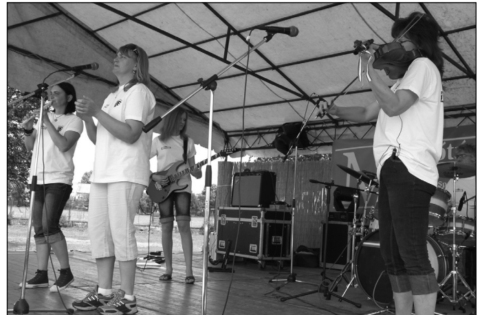
A déli meleg ellenére is jólesett a Folkográfia együttes zenéje, az ingyen kiosztott városnapos babgulyás mellé.