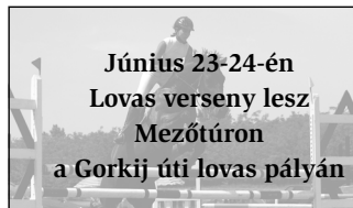
Június 23-24-én Lovas verseny lesz Mezőtúron a Gorkij úti lovas pályán