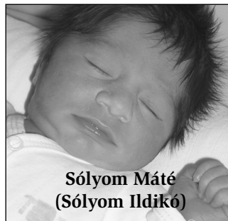
Sólyom Máté (Sólyom Ildikó)