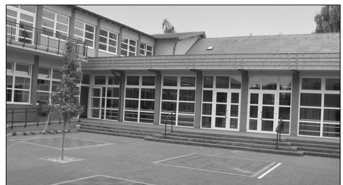
Az új iskola udvara

Aki mostanában Mezőtúron a Kossuth Lajos utca, a Csokonai Vitéz Mihály utca, és a Székes utca által határolt terület mellett halad el, azt láthatja, hogy a mezőtúriai által Kossuth úti iskolaként is ismert oktatási intézmény öreg épületei megszépültek, megújultak. Sok-sok ember