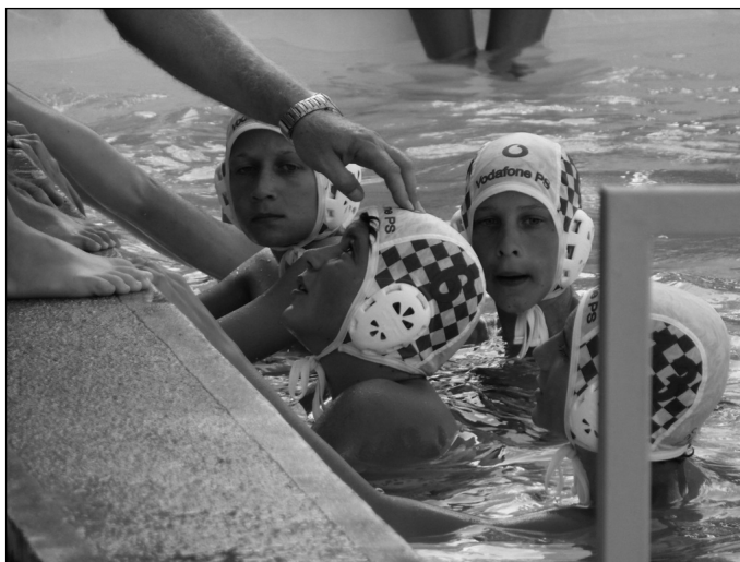
„Július 14-15-én újra megrendezésre került a Rose Kupa, immáron 13. alkalommal”

- Ha külön akarom venni a bizottság tevékenységét, elsősorban az oktatás területén volt a legnehezebb dolgunk. Mint tudjuk, jogszabály-változások miatt igen nagy az átszervezés, 2013. január 1-től mind az általános, mind a középfokú oktatási intézmények központosításra kerülnek, ami érinti nálunk az általános iskolákat és a Teleki Blanka Gimnázium, Szakközépiskola, Szakiskola és Kollégiumot. Mint ismeretes a Szeged-Csanádi Egyházmegyével tárgyalunk a Teleki átadásáról, azonban ezen egyeztetések végül tavasszal sikertelennek bizonyultak. A középiskolánk így marad önkormányzati tulajdonban, január 1-től pedig állami intézményként működik tovább, de a jövőt illetően továbbra is tárgyalunk az egyházzal. Az alapfokú oktatást nézve is sikeres tanévet zártunk, bár mindig felmerülnek az egész várost érintő problémák, mint például a demográfiai adatok negatív tendenciája, mely természetesen hatással van az iskolák gyermeklétszámára is. Így az állami