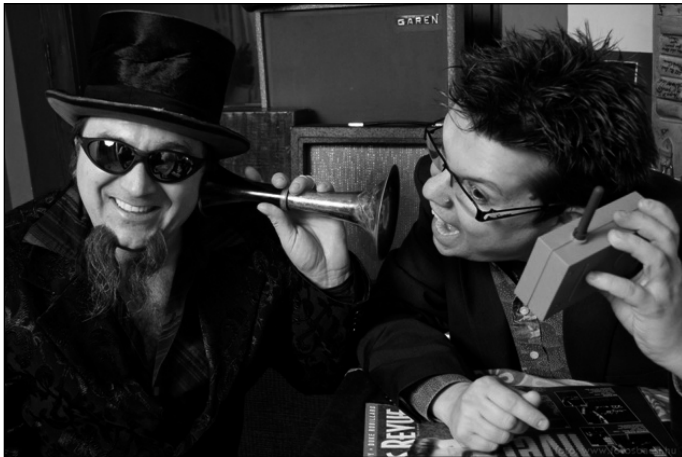
Mississippi Big Beat