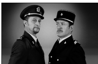
Augusztus 8. 20:30 Finánc a pácban francia filmvígjáték (2010) 12 éven aluliak számára nem ajánlott

A Túri Fazekas Múzeum szabadtéri filmvetítésekkel, városnéző idegenvezetéssel és kiállításaiival csatlakozik az arTúr Összművészeti Fesztiválhoz.