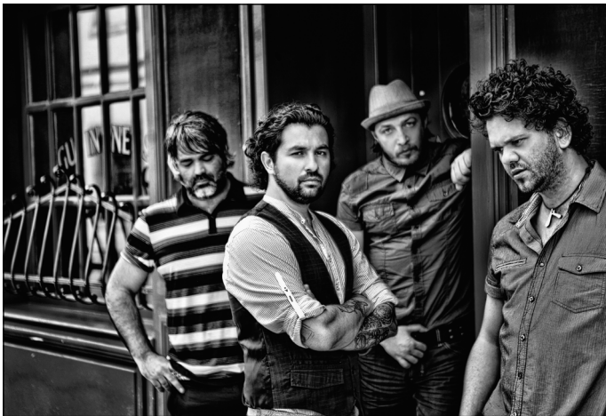
Magna Cum Laude