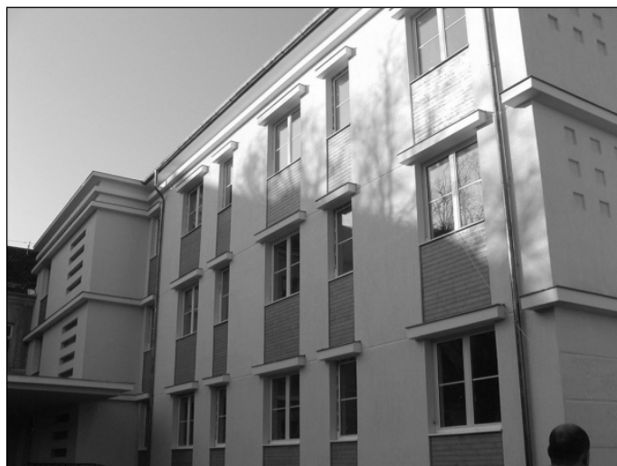
Mezőtúr Városi Kórház új épületszárnya

- Nem volt meglepő a pozitív mérleg, hiszen már a 2010-es évet is azzal zártuk. Ez a jó csapatmunkának köszönhető, illetve annak, hogy mindenki tudta mi a feladata, és azt maradéktalanul el is végezte. Az intézményben keretgazdálkodás folyik, és ennek nagyon szigorú az ellenőrzése. Egész év folyamán azt kerestük, hol tudjuk a költségeket csökken-