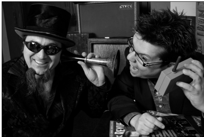
Mississippi Big Beat

Fotoklub kiállítása - helyszín: Közösségi Ház előtere