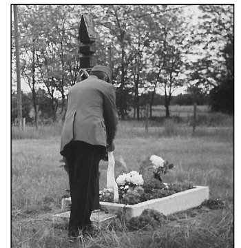
A fénykép 2012. május 29-én a Hősök napján készült, a sírről és a koszorúzásról

PUSZTAVACSI HELYŐRSÉGI NYUGDÍJAS KLUB NEVÉBEN