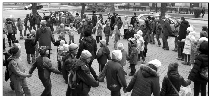
Flashmob a Szabadság téren

- A tehetségnapon bármely tehetségterületről a szakemberek előzetes ajánlása alapján legjobbnak vélt tehetségesek mutatkoztak most be-megjelentítve értékeiket a környezetük számára. Idén az Országos Tehetségnap szlogenje: „Fókuszban a fiatalok” címet viselte, s mi ehhez kapcsolódva egy széles korosztályi spektrumot, 7-20 éveseket vonultattunk fel. Nekem