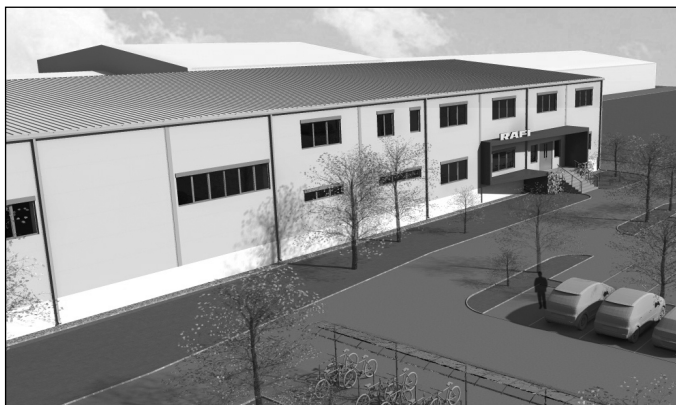
A Rafi Hungaria Kft. harmadik csarnokának látványterve

- Azt gondolom, hogy mint minden fejlődésnek ennek is voltak buktatói. Ennek ellenére a Rafi létszáma és árbevétele folyamatosan fejlődött, az 1991-es 4-5 fős kezdés után, napjainkban már 370-en dolgoznak a cégnél. A fordulópont 2002 után kezdődött, akkor települtek le az első automatív termékek és az első SMT beültető sorok. Addig főleg egyszerű szerelésű tevékenységeket folytatott a vállalat. 2002 után változott ez meg azzal, hogy az autóiipari termékek előszerelését idetelepítették, majd 2003-ban a hozzá tartozó gyártási folyamatokat is, gondolok itt az SMT sorokra, amelyekkel a hozzá tartozó nyomtatott áramköri lapok beültetése is