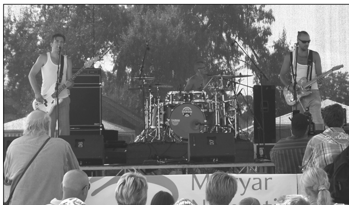
Roy és Ádám Trió koncertje