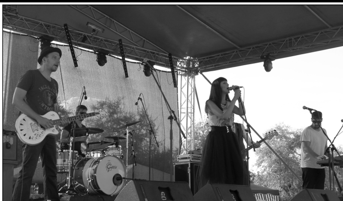
Magashegyi Underground koncert