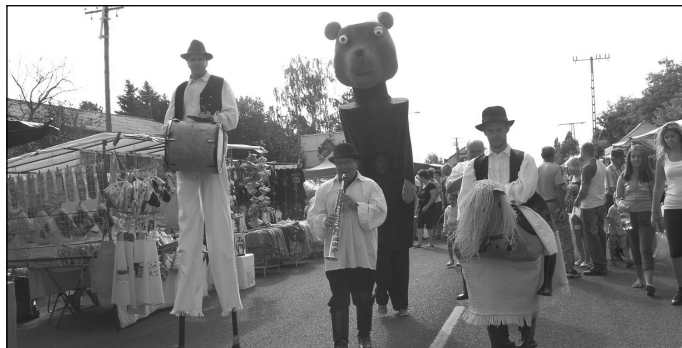
Óriásbábosok a Túri Vásár forgatagában