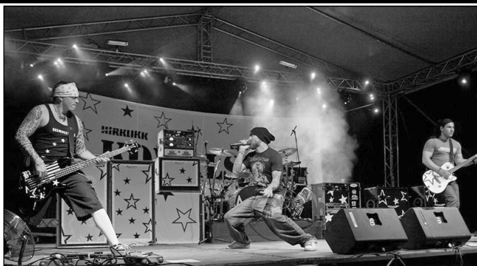
Kowalsky Meg A Vega koncert az arTúr fesztiválon