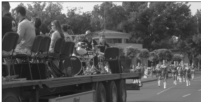
Felvonulás. Közreműködött a Dalma Dance Club mazzorett csoportja és a Reflex Band