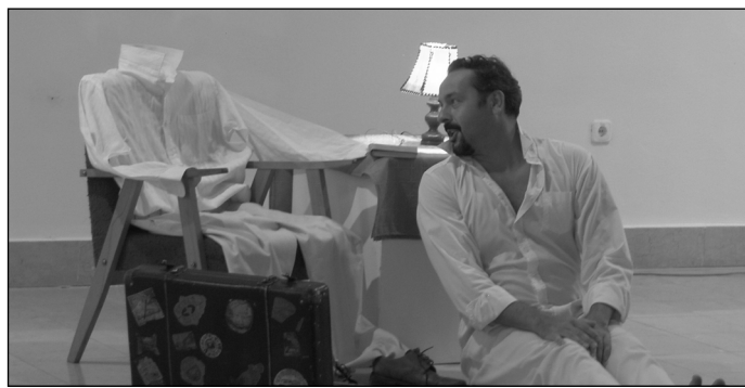
Turek Miklós - Pokolbéli világnéző c. előadása