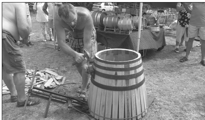
Kádármesterek bemutatója a Túri Vásáron