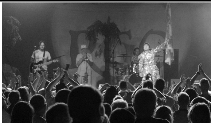
R-Go nagykoncert