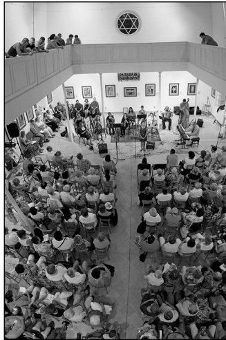
A Dalvarázs együttes koncertje

– A tavasz elején kiküldött jelentkezési lapok folyamatosan érkeztek vissza vásároló partnereinktől, ezzel párhuzamosan az idén újdonságként bevezetésre kerülő Polgármesteri Hivatalba történő regisztráció is folyamatos volt. – Ennek a regisztrációnak az a lényege, hogy a Hivatal külön törvényességi szempontból megvizsgálja az árusok tevékenységének jogosultságát. (Például a bejelentő nevén van-e még az adott vállalkozás.) – A jelentkezések beérkezése után a kollégáim feldolgozták az adatokat, elkészítették a vásár térképét, ahova berajzolták a jelentkezőket. Majd a Tulipán út és Szolnoki út sarkánál elhelyezett regisztrációs sátnál