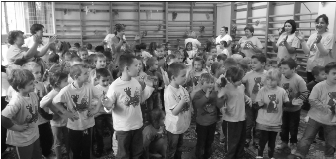
Alma-bál a Csoda-Vár Óvodában

2013. október 14-18-a között negyedik alkalommal rendeztük meg óvodánkban az őszi búcsúztató Csoda-vár napokat, mely sokszínű gazdag programokkal várta az óvodánkba járó gyermekeket és szüleit. A programjaink között voltak hagyományos illetve új elemek is, úgy érezzük minden gyermek és felnőtt megtalálta a számára kedves, felejthetetlen pillanatot. A hét csúcspontja a több mint húsz éves múltra visszatekintő „Alma-bál” és záró rendezvénye az Alma együttes koncertje volt.