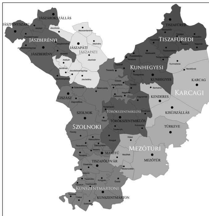
Jász-Nagykun-Szolnok megye járásainak székhelyei és a hozzá tartozó települések