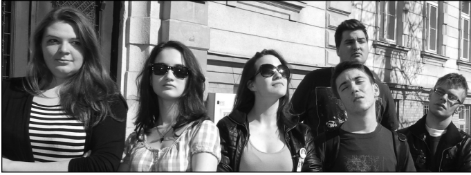
Filmsztárok a Dózsa György úton

Egy kisvárosban mindig nagy esemény, ha megjelenik egy forgatócsoport játékfilmet forgatni.