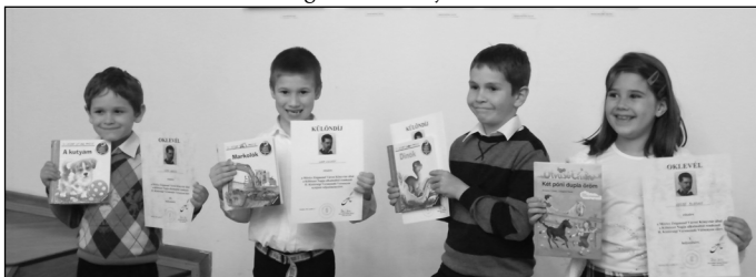
Költészet napi versmondó verseny elsős díjazottjai