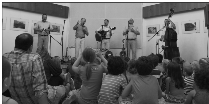
Kolompós Zenekar koncertje a Közösségi Házban

A főszervező kiemelte, hogy idén a Fesztivál és a Vásár egyaránt új logókkal jelent meg, valamint új külsővel jelent meg a programajánló műsorfüzet is. Újdonság és plusz elem volt a színpadtechnikához tartozó led fal is, amely jelentősen hozzájárult a koncertek látványához. A látogatottságot tekintve minden program teltházas volt. A rendezvényeket ez