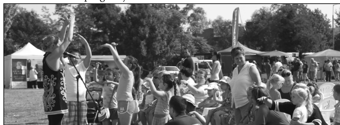
Gyermekműsor az Apacuka Zenekarral

lehet beszélni a fesztiválról és a Túri Vásárról is. Ezen a hétvégén nemcsak a fesztiválhangulat jellemezte városunkat, hanem a mezőtúri vendégszeretet is, hiszen augusztus 8-10. között látták vendégül testvértelepüléseink küldötteit is, akik nagyon jól érezték magukat a programokon. A továbbiakban még elmondta polgármester úr, hogy több visszajelzés is eljutott hozzá, amelyek azt támasztották alá, hogy a város lakossága és a kilátogató vendégek elégedettek voltak a programsorozattal. Zárszóként Herczeg Zsolt köszönetet mondott mindazon támogatóknak – külön kiemelve a mezőtúri vállalkozókat – akik anyagilag hozzájárultak a programsorozat megvalósításához. Valamint megköszönte a városi cégek, magánszemélyek, és mindazon szabadidős – sport – és civil közösségek munkáját, akik kísérőprogramjaikkal színesítették a fesztivál és vásár programjait.