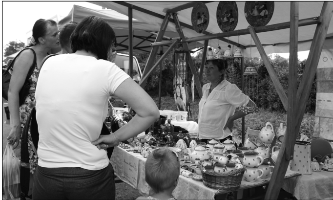
Népművészek a Túri Vásáron

évben is ingyenesen lehetett megtekinteni. Az időjárás szeszélyéhez nemcsak a szervezők alkalmazkodtak rugalmasan, hanem a kilátogató kicsik és nagyok egyaránt elkísérték az esőhelyszínekre a fellépő művészeket. A Kft. által szervezett programok mellett a kísérő rendezvények is nagyon sok érdeklődőt vonzottak, amelyek lebonyolítását ezúton is köszönjük. A szervezők nagy öröme a mezőtúri zenekarok és kulturális közösségek, szülő-