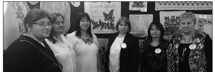
A mezőtúri hímzők delegációja

kiati testvérvárosukból, Párkányról és a romániai Torákról is érkeztek fellépők, a vajdasági területet pedig hat település népzenei, néptáncosai képviselték. A mintegy 2 órás rendkívül színvonalas műsor telt ház előtt zajlott, a törökbecsei