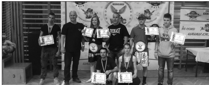
Baja - International Championships