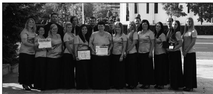
Nagybányai pillanat a nemzetközi verseny után...

Ezúton is szeretnénk megköszönni a Közösségi Ház és Mezőtúr Város