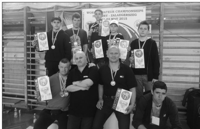
Zalaegerszeg - WAKF szövetség amatőr világbajnoksága

2015. április 30. - május 03. Zalaegerszegen került megrendezésre a WAKF szövetség amatőr világbajnoksága. Görög, olasz, szerb, fehérorosz, lengyel versenyzők mellett a hazai küzdősport egyesületek versengtek a világbajnoki címért. A TVSE kick & thai-boks szakosztálya 9 fővel vágott neki a megmérettetésnek kick-light, light-contact, point-fighting, low-