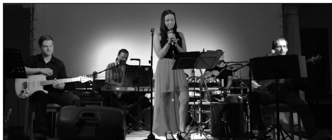
Acoustic World

A programsorozat időtartama alatt kedvünkre válogathattunk a színesebbnél színesebb programok között. Ki-ki zenei ízlésének, érdeklődési körének megfelelő látni-hallgatni valót találhatott városunk különböző pontjain. A Túri Vásár a hét záró programjaként méltán lehet büszke híre-re-nevére, amelyet még a nóta is megörökít. A vásárba érkező árusító partnereink számát tekintve idén sem lehetett okunk panaszra. Vásárfiát mindenki találhatott magának. A vásári forgatagban megfáradtak beülhettek a hatalmas, térkövezett fesztiválsátorba, és az egésznapos színpadi műsorkínálatból választhattak kedvükre. A hét zárásaként idén is megtekinthettük a tűzijátékot.