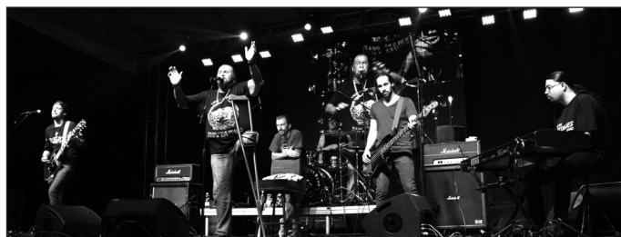
Deák-Bill Blues Band

azoknak is, akik idejüket nem sajnálva megtisztelték jelenlétükkel programjainkat. Bízunk benne, hogy jövőre is hasonlóan színes programkínálatlal kedveskedhetünk majd Önnek! Bővebb beszámolóinkat következő számunkban olvashatják. Képgalériánkat megtekintheti a www.muveszetinapok.hu , valamint a turivasar.hu internetes oldalakon.