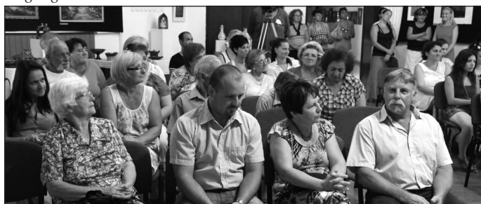
A kiállító család

2015. augusztus 4-8 között került megrendezésre az arTúr Fesztivál, augusztus 9-én a Túri Vásár. A programsorozatot nagy érdeklődés előzte meg, hiszen az elmúlt évek bizonyították, hogy kulturális, sport és egyéb program kínálatával méltán beszélünk városunk és a térség legnagyobb rendezvényéről. A rendezvény nagyságával, jelentőségével párhuzamosan kimagasló a látogatók száma, és ami a legfontosabb, a városi összefogás mértéke; amely ilyenkor bizonyítja be, hogy egy közös cél elérése érdekében szervezetek, magánszemélyek, vállalkozások, polgármesteri hivatal és önkormányzat egy emberként egy célt tart a legfontosabbnak: a programsorozat minél sikeresebb lebonyolítása az Ön, kedves Olvasónk legnagyobb meglepedésére.