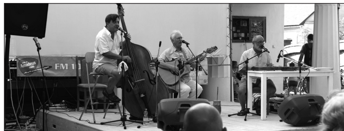
Kalácsa Együttes

Külön köszönettel tartozunk a mezőtúriak részvételével megvalósult programokért: fesztiválnyitó programok, zenei koncertek, kiállítás, sportprogramok, találkozók. Ezek megszervezése és lebonyolítása azon tiszteletreméltó emberek tenniakarását tükrözi, és azt bizonyítja, hogy városunkban még sokan vannak, akik a közösség igényét szem előtt tartják, és legfőbb motiváló erejük az értékközpontú alkotás, tenni akarás. Köszönjük