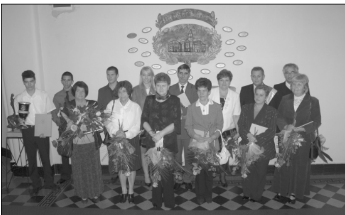
Gratulálunk a kitüntetetteknek!