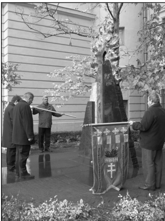
Az 56-os emlékmű koszorúzása