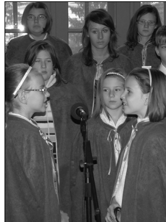
A Református Kollégium megemlékező műsora