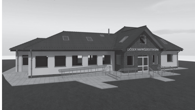
Látványterv- az új Fóti utcai idősek otthona

ülés fontos témája volt a Fóti utcában megépülő idősek napközi otthona, melyhez 166 millió forint pályázati forrást nyert az önkormányzat. Az előzetes kalkulációk szerint a fejlesztési hitelkeretből további 53 millió forintot szükséges hozzátenni az elnyert támogatáshoz. A képviselő-testület egyhangúlag támogatta a beruházás megvalósítását.