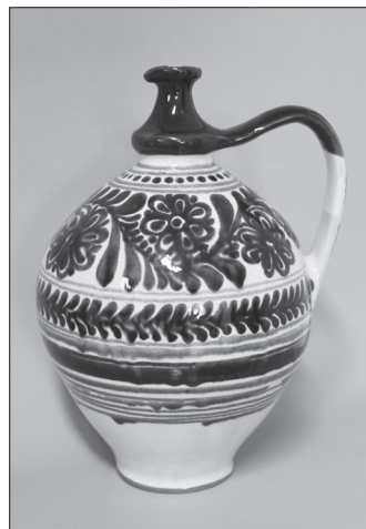
Zilahi motívumos butykoskorsó 1982-ből