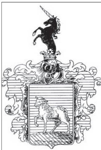
Trázi Imre nemesi címerterve

75 éve, 1947. január 14-én lépett életbe Magyarországon az 1947. évi IV. törvénycikk egyes címek és rangok megszüntetéséről.