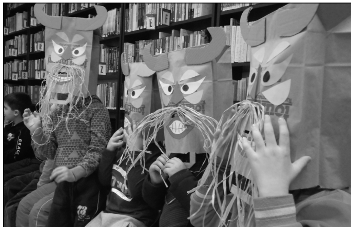
Farsangoltunk! Rengeteg hiedelem, szokás fűződik a farsangi ünnepkörhöz. Ezekből elevenítettünk fel néhányat a gyermekkönyvtárban, többek közt a Csodavár Óvoda „Süniseivel”. Elűztük a telet, majd látjátok túriak!

A Móricz Zsigmond Városi Könyvtár és a Községi Ház 2013. április 19-én rendezi meg a III. Óperenciás Bábvesztivált általános iskolai csoportok részére.